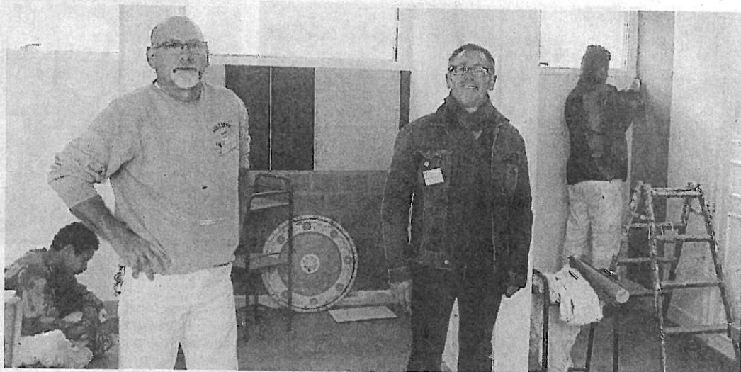
« La clé d'entrée, c'est l'atelier ! » Ici, l'Atelier peinture en action, avec, au premier plan, les deux éducateurs techniques.

Pour ces jeunes en difficulté « la clé d'entrée, c'est l'atelier ». Les ateliers cuisine (pâtisserie), peinture, maçonnerie et jardinage sont autant d'occasions de découvrir et cultiver « à leur rythme » leurs compétences, et surtout de « retrouver l'estime de soi ». Une remise en confiance qui se nourrit aussi d'une approche scolaire personnalisée, et de la confrontation à de multiples activités sportives et citoyennes. « Nous disposons d'un atelier de médiation et de création et des sorties sont régulièrement organisées ». Comme un camp vélo de quatre jours, dont six jeunes